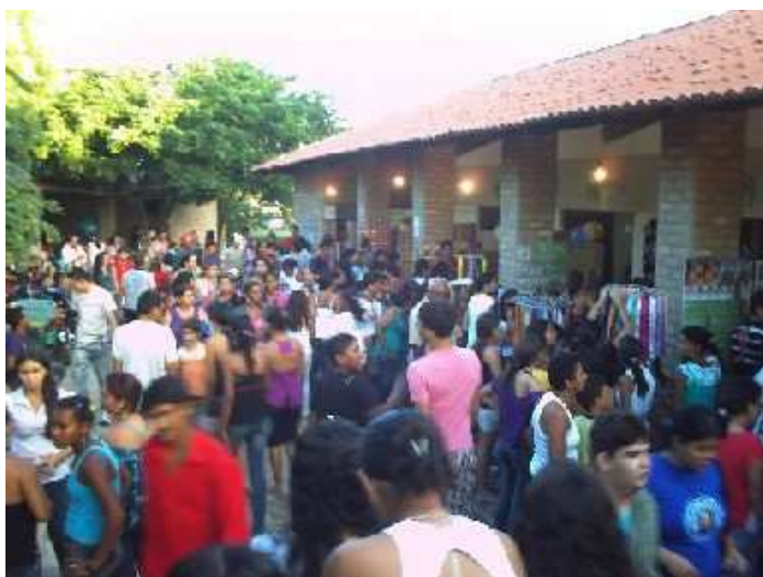
Figura 7: Boxes do Parque Turístico Religioso Cruz da Menina. Fotografado em maio de 2009.

Existem os boxes, os quais comercializam diversos artigos religiosos, entre eles: imagens, escapulários, terços, revistas e cordéis que contam a história da Menina Francisca, velas, chaveiros, fitas, brinquedos, etc. As pessoas sempre passam pelos boxes para comprar lembranças para familiares, sobretudo, a imagem de Santa Francisca e de outros santos. Assim, na prática devocional foi introduzida a compra e venda de artigos religiosos. Levar uma lembrança do santo para casa é uma forma de prolongar a presença de Santa Francisca no seu cotidiano. Os boxes são bem movimentados no dia de pentecostes e em épocas de romarias como podemos ver na imagem abaixo: