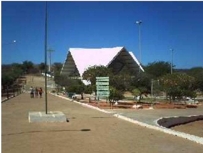
Figura 5: Parque Turístico Religioso Cruz da Menina. Fotografada em novembro de 2008.

O Parque é uma área cercada, a capela, as salas de milagres e a sala das velas são cobertas por uma estrutura de ferro em forma de pirâmide. Como podemos ver na fotografia: