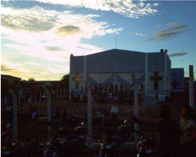
Figura 14: Imagem da igreja Nossa Senhora das Dores. Fotografada em maio de 2009.

Assim, com as modificações na estrutura do parque, a devoção foi ressignificada e atualizada. Mesmo os políticos apostando no aumento da participação dos devotos no parque, com vista ao turismo, este atualmente, sobretudo, nos dias de semana, não tem recebido muitos visitantes. Os moradores da Vila Mariana e de Patos de uma maneira geral visitam com pouca frequência. As visitas e práticas de devoções se concentram mais nos finais de semana, feriados, dia de pentecostes, quando a Igreja Católica realiza uma missa no interior do Parque, e nos períodos de romarias.