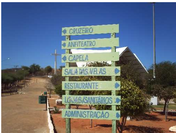
Figura 6: Setas informativas do Parque Turístico Religioso Cruz da Menina. Fotografada em novembro de 2008.

Logo na entrada existe um painel com setas informando os espaços que o Parque possui e a direção a seguir: