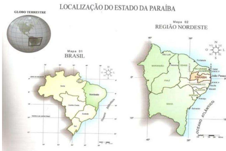
Figura 1: Localização do Estado da Paraíba. Mapa retirado do Atlas Escolar da Paraíba, 2000, p.11.

A devoção à Menina Francisca se realiza no município de Patos- PB, região sertaneja do Estado. Parada dos romeiros, principalmente nos meses de janeiro e novembro, que vão ao Ceará onde se realizam as tradicionais devoções “populares”, como a do Padre Cícero no Juazeiro do Norte, e a devoção a São Francisco no Canindé, instaurando-se uma rede de peregrinação, articulando locais de visitação e devoção. Podemos ver na figura a localização do estado da Paraíba: