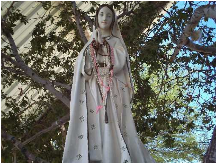
Figura 13: Imagem de Nossa Senhora no interior do Parque Cruz da Menina. Fotografada em novembro de 2008.

À frente da capela há uma imagem de Nossa Senhora posta sob uma árvore: