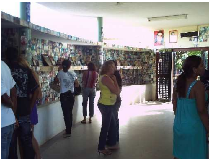
Figura 10: Sala dos milagres. Fotografada em maio de 2009.

Bem próxima à sala das velas situa-se o pátio, onde podemos encontrar duas salas de milagres, cujo interior é relativamente grande e no meio a capela. Nas salas são depositados os ex-votos. Observamos nas salas muitas fotografias, imagens de santos, encontramos também partes humanas em vidros retiradas em procedimentos cirúrgicos, roupas, bonecas, e réplicas de pernas, braços, mãos e casas. A fotografia mostra uma das salas de milagre: