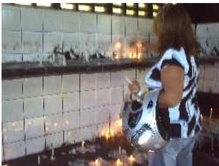
Figura 8: Devota na sala de velas. Fotografado em novembro de 2008.

Em frente ao posto policial e ao anfiteatro, podemos encontrar a sala das velas, mas com a porta voltada para as salas dos milagres.