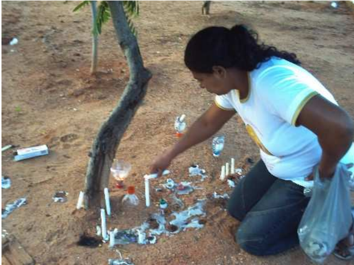
Figura 9: Devota acendendo vela embaixo da árvore no interior do Parque Cruz da Menina. Fotografado em maio de 2009.

Porém, como já afirmamos as pessoas não seguem a normatização presente na devoção, acendem suas velas nos mais variados locais, não se limitam a forma que foi instituída na construção do Parque. Na fotografia podemos observar uma devota acendendo velas embaixo de uma árvore: