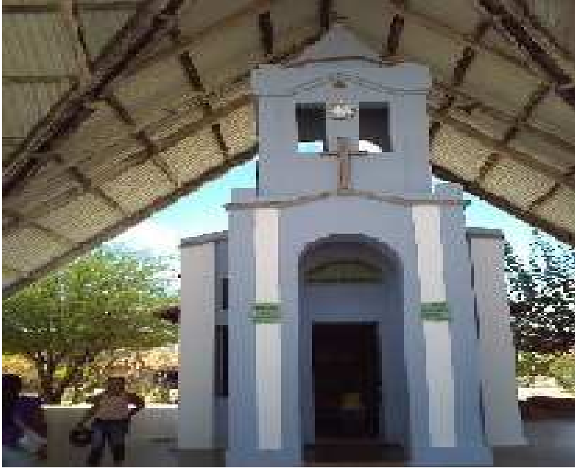
Figura 11: Capela da Menina Francisca. Fotografada em novembro de 2008.