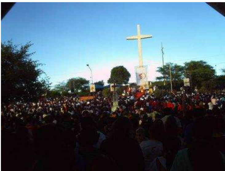
Figura 3: Missa de Pentecostes. Fotografada em Maio de 2009.

Esta imprecisão se exacerba na festa de pentecostes realizada no Parque Religioso, quando pudemos observar que há celebração da missa e os sermões dos padres, mas há também pagamentos de promessas a Santa Francisca, pessoas em número expressivo na capelinha de Francisca e nas lojinhas para levar alguma lembrancinha dela para casa. As duas formas de catolicismos coexistem. Podemos observar uma imagem da missa de pentecostes: