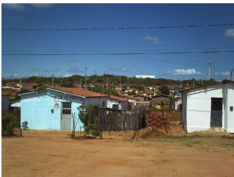
Figura 4: Casas da Vila Mariana. Fotografada em agosto de 2009.

Na fotografia a seguir, podemos observar a estrutura de algumas casas construídas mais recentemente na Vila Mariana. Embora existam casas já reformadas, a maioria delas corresponde ao tipo de casas populares, chamadas embriões.